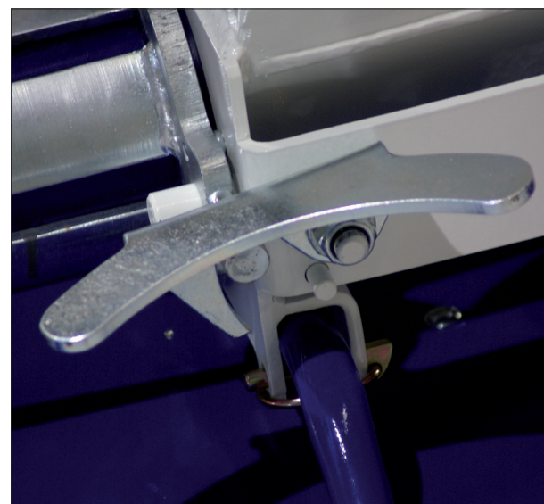
^ Einfach zerlegbar und leicht zu reinigen.