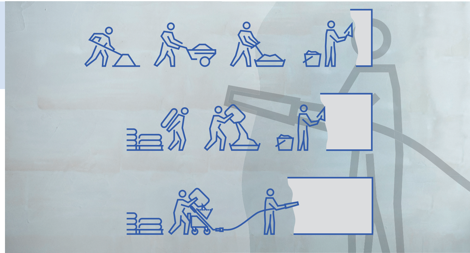
^ So macht Arbeiten Spaß: effizient und wirtschaftlich!